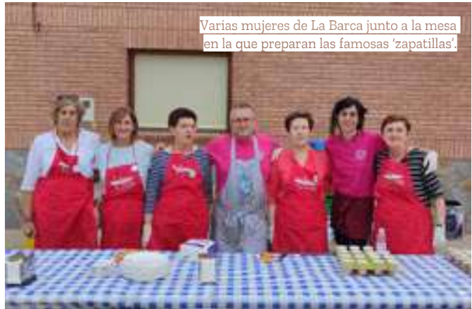
Varias mujeres de La Barca junto a la mesa en la que preparan las famosas 'zapatillas'.

El día grande para la asociación dentro de las Fiestas Patronales es el Día de la Mujer, que este año se celebra el viernes, 11 de agosto. “Esperamos con ilusión ese día porque al estar dedicado a las mujeres lo vivimos de manera más especial”, expresan varias mujeres de la junta directiva. Ese día, se celebra una misa en honor a la Virgen de los Remedios, y las mujeres le hacen entrega de un ramo de flores. Además, se nombra a las socias fallecidas de La Barca. Este año, como novedad, cambia la ubicación del vermut-comida, que tendrá lugar tras la misa, y que este año se celebrará en el patio de las escuelas. Además, el día 10 de agosto colaboran en el programa festivo con el reparto de los dulces y el licor. Las mujeres de La Barca hacen una buena valoración de su actividad durante el último año. Vol-