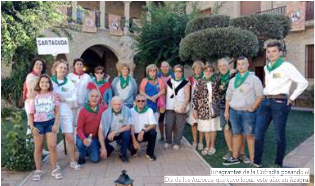
Integrantes de la Cofradía posando el Día de los Auroros, que tuvo lugar, este año, en Azagra.

Sin duda, las próximas Fiestas en honor a la Virgen de la Monlora serán especiales. Desde la Cofradía indican que quieren organizar algo diferente, quizá para los niños con la temática de la Virgen. Vendrá a cantar el grupo de jotas de Calahorra y se celebrará una eucaristía más especial. “Además nos gustaría contar con la presencia del Obispo”, informan desde la Cofradía. También nos acompañarán nuestros compañeros de la Hermandad de la Virgen de la Monlora de Luna y, como no, los mayordomos. Y al día siguiente, el pan, el vino y la lotería. Las tradiciones hay que cumplirlas.