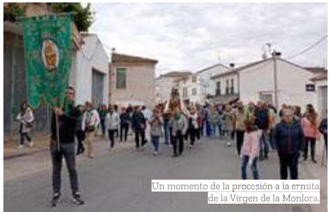
Un momento de la procesión a la ermita de la Virgen de la Monlora.

Respecto a las actuales necesidades del colectivo religioso, demandan participación y colaboración. “Que no se pierda la tradición de la Cofradía”, añaden. A lo largo del último año han participado en el encuentro con la Hermandad de la Virgen de la Monlora de Luna (Zaragoza) y