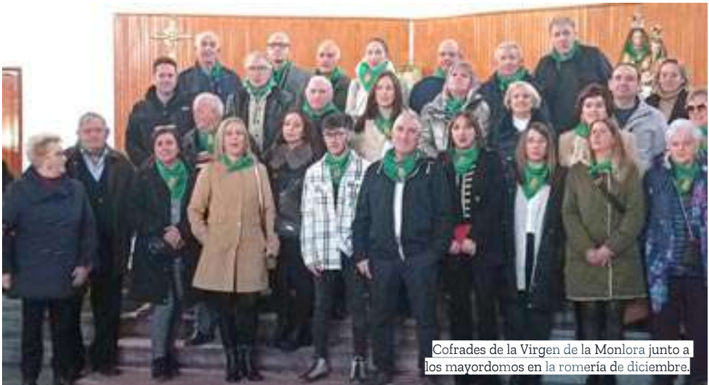
Cofrades de la Virgen de la Monlora junto a los mayordomos en la romería de diciembre.

El colectivo espera con ilusión el mes de diciembre, cuando se cumplirán 200 años de su fundación