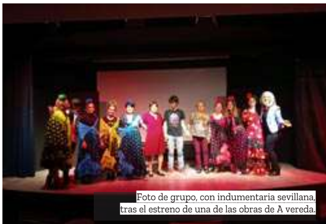
Foto de grupo, con indumentaria sevillana, tras el estreno de una de las obras de A vereda.

sonas se animaron a crear un grupo. La obra 'Viva el duque nuestro dueño' fue la primera que se estrenó oficialmente y ya desde ese momento el grupo fue creciendo.