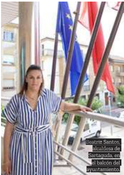
Beatriz Santos, alcaldesa de Sartaguda, en el balcón del ayuntamiento.