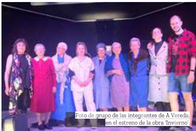
Foto de grupo de las integrantes de A Vereda, en el estreno de la obra 'Invierno'.

La entonces Peña La Ribera hizo un taller de teatro y varias per-